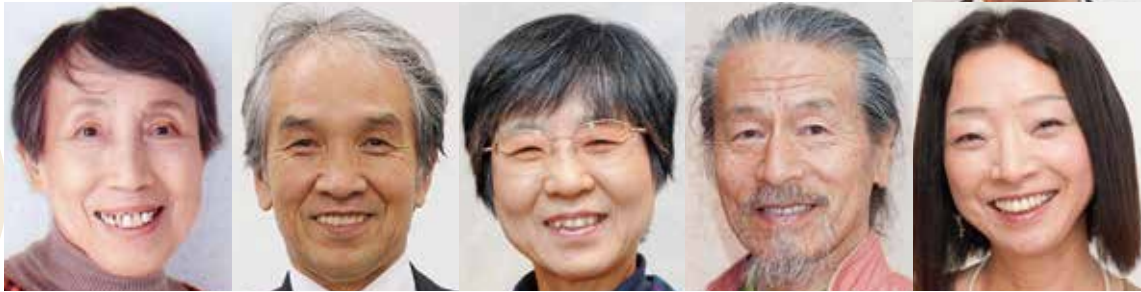
ガンを治した〈治ったさん〉たち